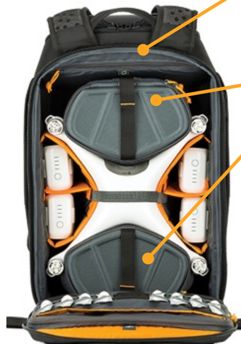
Widok z tyłu