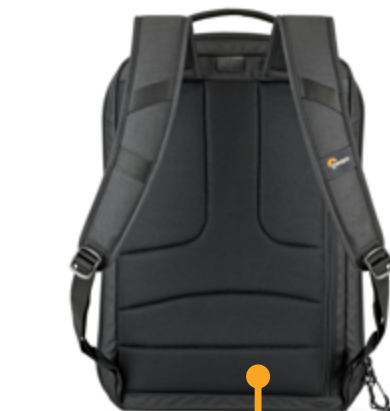
Widok z tyłu